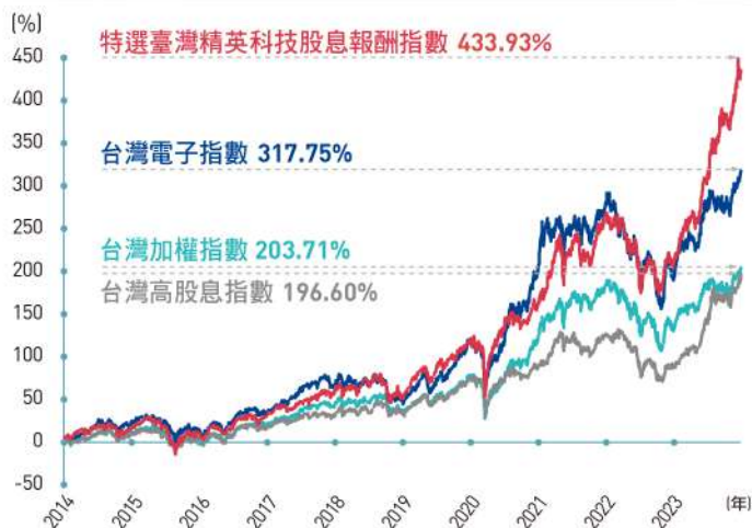
過去十年，各指數含息總報酬率走勢圖

本基金以特選臺灣精英科技股息報酬指數為績效參考指標。本基金並非指數型商品；指數資料僅供參考，不代表本基金實際投資情形及績效表現。以上資料為舉例說明，不代表未來實際績效。指數之股息殖利率不代表基金配息率。特選臺灣精英科技股息報酬指數，係自台灣上市上櫃科技類股市值前250大之公司，依據流動性、報酬波動度、股息穩定度、長短期本益比乖離程度以及獲利能力等指標篩選，再以股息殖利率擇優精選40檔成分股並配置權重；指數每半年調整成分股。指數之股息殖利率係指報酬指數(含股息及其再投資收益)與價格指數(僅反應股價變化)累計報酬之差額。